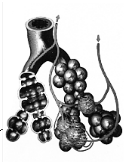
Aufbau der menschlichen Lunge